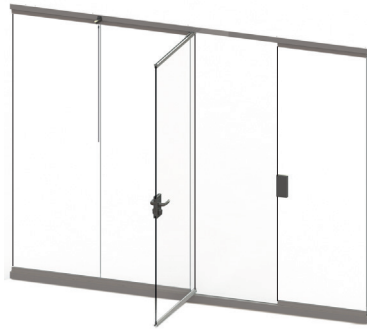
SLIDING DOOR ABIERTO